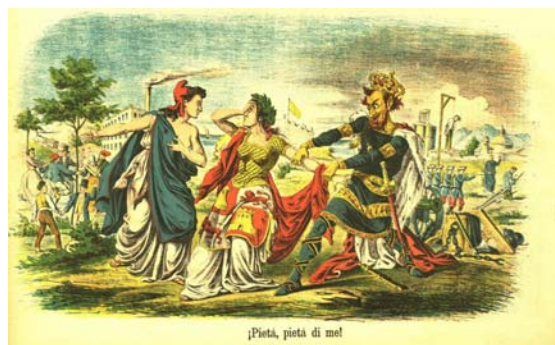
Al·legoria d'Espanya indecisa entre la Monarquia i la República. Revista La Flaca , 15 de maig de 1865.

Aquesta mostra sobre Pep Ventura, ens apropa a la figura del músic empordanès però també a la Figueres de l'època, que fou escenari de les evolucions musicals lligades al