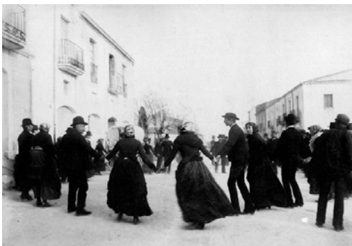
Vilasacra, hivern 1888-1889.